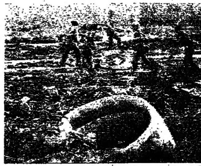
حطام الطائرة في منطقة قرب سايفون (صورة بالراديو من ا.ب.) امل استعادة الاطفال التي خسرتها (صورة بالراديو من ا.ب.) وكانت حكومة سايفون قد قالت امس انها اجتمعت محاولة انقلابية

قد اعتقوا بعد المحاولة الانقلابية وهي الثانية في اسبوع. وفي غضون ذلك وردت انباء عن اشتداد المقاومة ضد التقدم الشيوعي بعد التخلي عن سلسلة من رئيسية للشيوخ وقرار للساكن المحليين في حالة من التوضى. ضد هجوم وادعى ناطق عسكري ان القوات